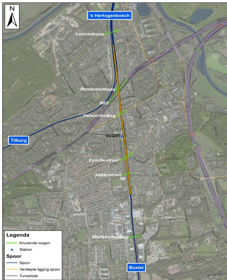
Afbeelding 2: Locatie van de verdieping te Vught in Variant V3 Oost Verkort