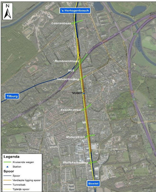
Afbeelding 1: Locatie van de verdiepte ligging te Vught in Variante V3

Variante V3 betreft een extra vierde spoor tussen 's-Hertogenbosch en Vught, een vrije kruising bij Vught Aansluiting en een tweesporige verdiepte ligging van het spoor. De verdiepte ligging van het spoor wordt op de locatie van het huidige spoor aangelegd en heeft een lengte van circa 1.610 m gerekend vanaf de splitsing naar Tilburg tot en met de kruising met de Molenstraat (zonder toeritten). Het verdiepte liggende spoor is zodanig ontworpen dat het profiel van de kruisende wegen op maaiveld blijft, zoals in de huidige situatie ook het geval is. De Loonsebaan en de Wolfskamerweg kruisen het spoor onderlangs. De onderdoorgang van de Loonsebaan is alleen geschikt is voor langzaam verkeer. Aan de westzijde van het spoor worden over een lengte van 1.365 meter geluidsschermen geplaatst. Aan de oostzijde over een lengte van 1.500 meter. In totaal worden 15 bedrijfspanden gesloopt. Als gevolg van de aanpassing van de spookruising met de N65 worden 3 woningen gesloopt. De bouw van de verdiepte ligging duurt 4 jaar en 9 maanden. Kenmerkend voor de bouwperiode is het opbouwen van het tijdelijk spoor door Vught en een tijdelijk station. Over een lengte van 3,3 km worden 2 tijdelijke sporen aangelegd aan de westzijde van de huidige spoorbaan. Het tijdelijke spoor zal ca. 3 jaar tot 3,5 jaar in gebruik zijn. Daarnaast worden 31 panden aangekocht, omdat die panden tijdens de bouwwerkzaamheden niet bewoonbaar zijn.