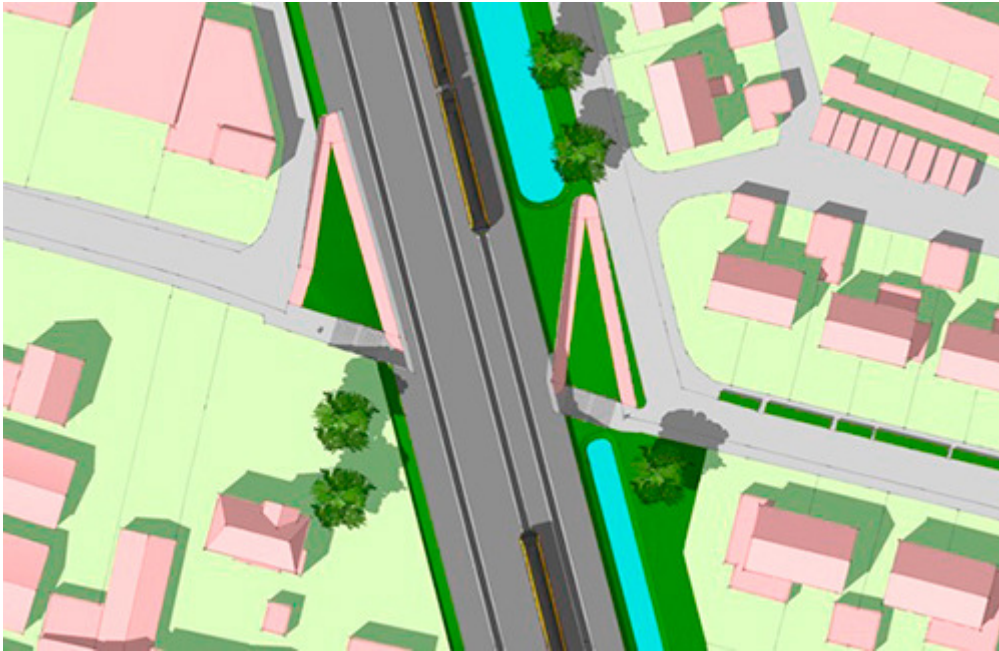
Ontwerpen hellingbanen Nieuwsteeg

De eerste concepten van de inpassingsplannen voor de nieuwe Randweg en de Lingedijk zijn gereed. Deze worden nu getoetst op uitvoerbaarheid door onder meer het Waterschap. De plannen zullen ook aan de orde komen tijdens de omgevingstafels.